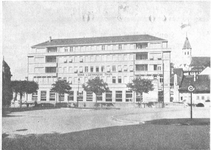
Die neue Spar- und Leihkasse Thun.

Nach der Verlegung des Bahnhofes gegen Scherzigen erwarb die Kasse das „Hotel zum weißen Kreuz“, ließ es niederreißen und durch die Firma Grütter & Schneider ein den modernsten Anforderungen genügendes Geschäftshaus und Wohnhaus erstellen, das Thun zur Ehre gereicht, jedoch den schönen Ausblick vom Bahnhof auf Burg und Kirche beeinträchtigt. An der Stelle des Gasthofs zum Kreuz standen im Mittelalter das Sähhäus des Klosters Interlaken und das Zollhäuschen bei der Scherzigenbrücke. Beide Gebäude lehnten sich an die Ringmauer am Graben, der nun von der äußeren Aare durchflossen wird. Wo heute die Safes wertvolle Sachen aufnehmen, entdeckte man beim Abbruch die Fundamente eines alten Festungsturmes; die letzten Reste der Stadtmauer sind erst vor einer Woche weggerissen worden.