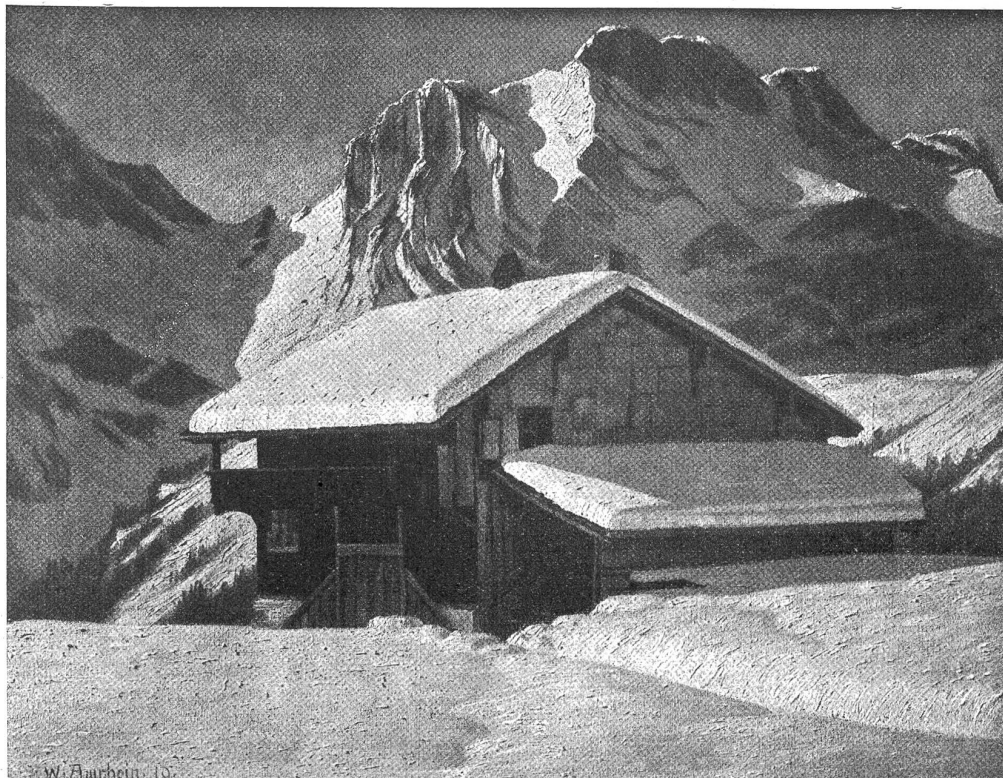
Amrhein: Winterlandschaft mit Speicher.

„Mutter!“ rief er verzweifelt, „ihr Frauen habt kein Herz — alle miteinander habt ihr kein Herz. — Wenn du wüßtest, wie ich herumgelaufen bin — wie ein Wahnsinniger.