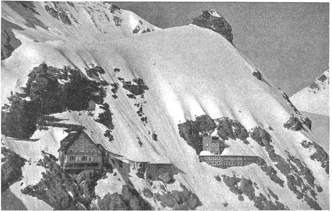
Forschungshaus auf Jungfraujoch (rechts), links Hotel Berghaus, Mitte Touristenhaus der Jungfraubahn. Auf dem Felsgipfel rechts („Sphinx“) ist ein Stützpunkt für meteorologische Beobachtungen mit Ausblick nach Westen gerichtet.

Ich aber fühlte, wie ich weder dem Vater noch der Schwester das geben konnte, was mich als ein geheimnisvolles Zuviel schon von Kind an in meinem Herzen so arg bedrängte; so mußte ich es gewaltsam in mir festhalten und mich immer wieder ganz allein für mich darüber wundern. Kein Mensch sprach je von so etwas, kein Mensch außer mir mußte etwas derartiges wissen oder fühlen. Nur in mir also lebte solch ein Sonderbares, das lästig und schmerzlich und unheimlich war und dann doch plötzlich wieder so gnadenreich, daß man allen Kummer darüber vergaß. Was war es, das man einmal verbergen möchte wie die tiefste Schande und ein andermal spürte man es eng im Hals und erstikte fast darüber, weil man es nicht hinausjubeln konnte?“ — (Fortsetzung folgt.)