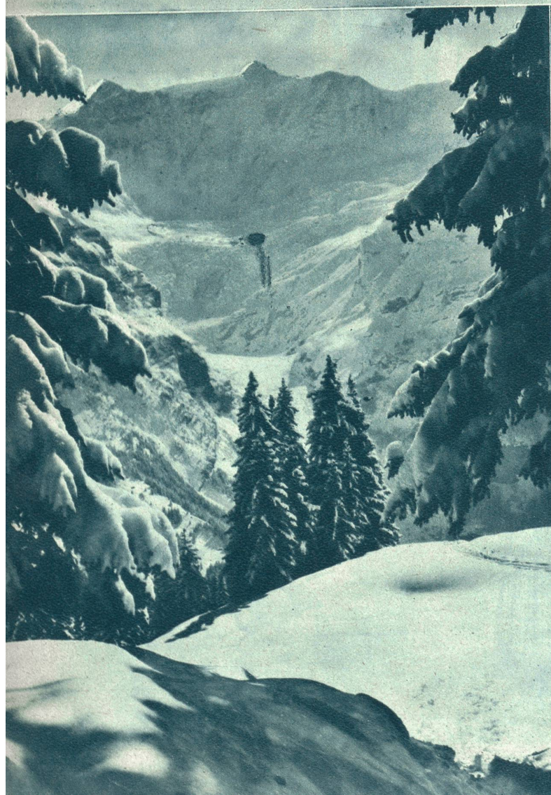
Unten rechts: Bei Adelboden im Gilbach.