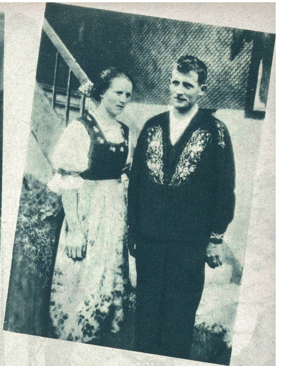
Fürstenländerin aus Wil.