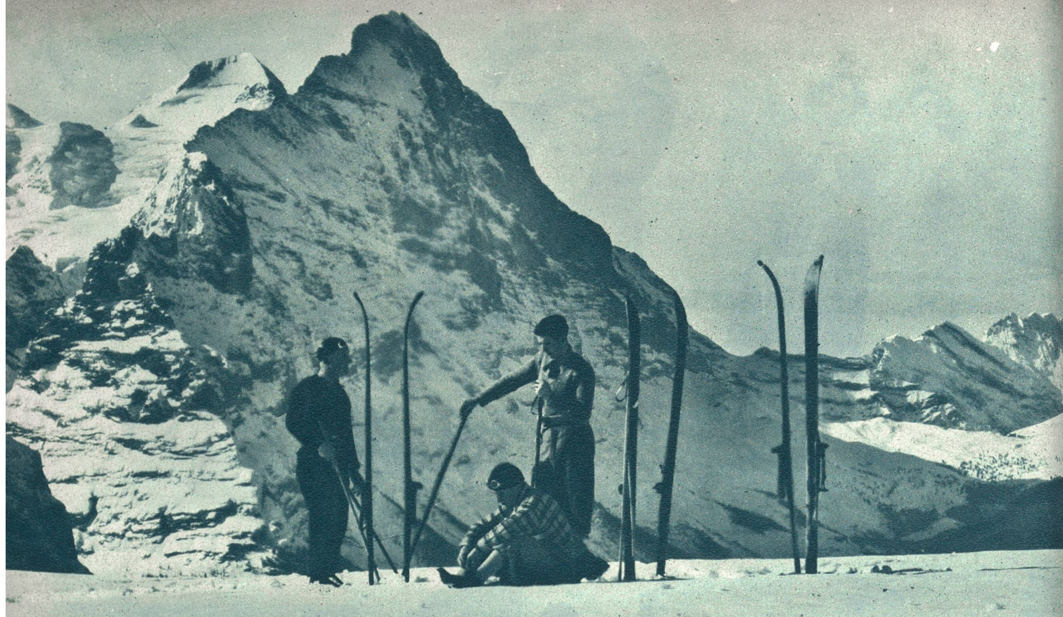
Der Eiger ob Grindelwald.