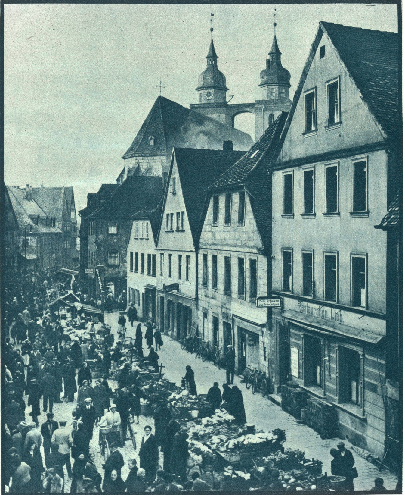
Das alte Bayreuth,