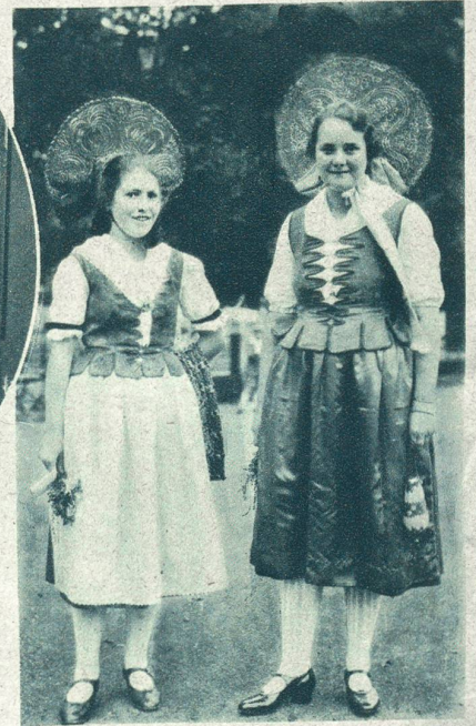
Rechts: Neue Stadt-St.-Galler Festtracht.