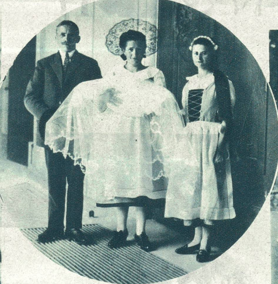
Eine Taufe in der Landestracht (Sarganserländer, Kt. St. Gallen).