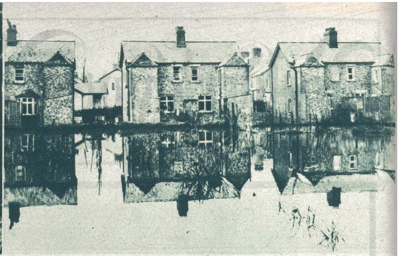
Erstes Bild von den Ueberschwemmungen in Südfrankreich. Die Hauptstraße der Stadt Béziers, die am schwersten mitgenommen wurde.