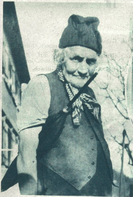
Typischer Appenzeller.