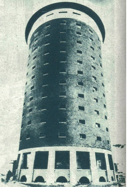
Das seltsamste Hotel der Welt wurde kürzlich auf dem Berg Sestri in Oberitalien erstellt. Es ist hauptsächlich für Wintersportler bestimmt.