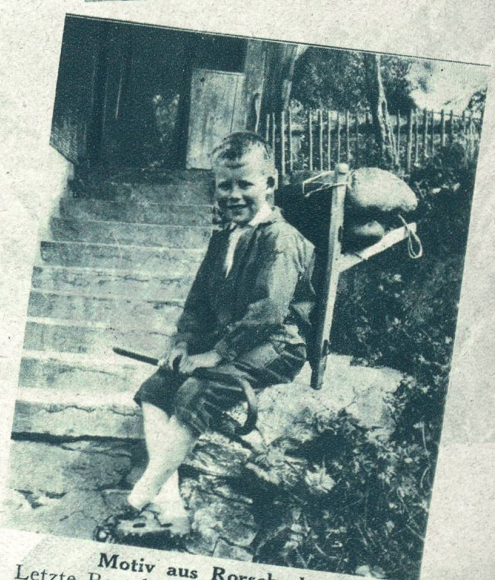
Motiv aus Rorschach. Letzte Rast beim Holen des täglichen Brotes.