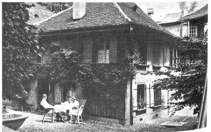
Teilansicht aus der ehemaligen von Steigerbesitzung.

Insofern unterscheidet sich diese zur Schau gestellte Bierzimmer-Wohnung von andern in Bern bisher gezeigten ähnlichen Veranstaltungen, indem sie rein auf das Nützliche und Praktische eingestellt ist und unabhängig von üblichen Möbelgeschäften ihrem Selbstzweck genügen kann. Die einzelnen Zimmer sind nicht nach sogenannten Ameublements möbliert, vielmehr sehen wir, daß die ganze Zusammenstellung aus Einzelstücken besteht, aus „Typen“, die für sich den größten Anforderungen Genüge leisten. Es zeigt sich dabei, daß trotz dieser Vielgestaltigkeit gesamtthaft eine grobe Einheitlichkeit besteht, eine Harmonie und ein Zusammenklang aller Details zu einem Ganzen, das nur erfreulich wirkt. Alle Möbel in Holz wie in Stahl sind von Dr. S. Klameth geliefert, welcher später in seiner Wohnung eine permanente Wohn-Ausstellung einrichten will, um dem Publikum jeweils das Neueste auf diesem Gebiete praktisch vorführen zu können. Als weiteres wichtiges Moment der Wohn-Ausstellung auf dem Bierhübeli sind die zahlreich vorhandenen Hand-Webarbeiten zu nennen. Sie geben die Wärme und Farbe und verleihen der kühlen Sachlichkeit Gefühl und Seele. Besonders erwähnenswert sind die edlen Möbelstoffe. Stahlrohrstühle in verschiedener Form, sogenannte Coutschs usw. sind mit solchen soliden Geweben