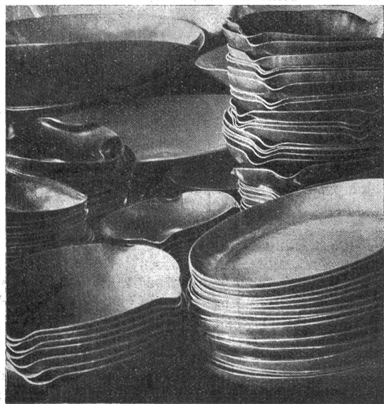
Zum Artikel „Arbeiten älterer Arbeitsloser“. (S. 180.)

pflichte in jeder Form. Wenn wir dieses Wort in seiner ganzen Tragweite beherzigen wollten, so müßte jeder, der heute noch im Besitz von überflüssigen Mitteln ist, sie für den notleidenden Bruder verwenden. Das kann nicht durch Gesetze geschehen, sondern jeder einzelne muß sich selbst dazu einstellen, sein Gewissen muß ihm sagen, inwieweit er dem Bruder verpflichtet ist. Jeder von uns hat Gelegenheit, diesen Verpflichtungen nachzukommen. Oder kennst du nicht in deiner Nachbarschaft einen Notleidenden, dessen Kindern geholfen werden sollte, daß sie sich zu tüchtigen Menschen ausbilden könnten? Könntest du, junge Frau, nicht ein Mädchen auf deine Kosten ausbilden lassen oder ihm wenigstens einen Beitrag an seine Lehrkosten geben? Wäre es dir, alleinstehendes Fräulein oder dir, Junggefelle, nicht