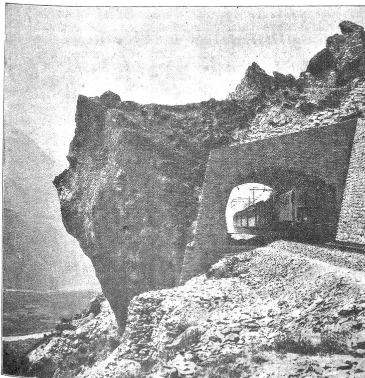
Viktoria Tunnel auf der Südrampe.