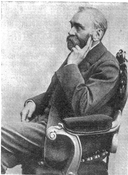
Portrait Nobels aus dem Jahre 1896.

Das alles trifft auf den Mann zu, den die Natur zum Dichter, Denker, Grübler und Vorkämpfer der wichtigsten