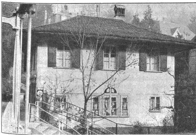
Das alte Zollhaus bei der Altenberg-Hängebrücke.

Bekanntlich sind seit 1850 die Brückenzölle aufgehoben. In dem alten, grauen Haus jenseits der Hängebrücke war seit Jahrzehnten ein „Chrämmerladen“ eingerichtet. Unbeachtet des großen Publikums erfüllte es bis zum Abbruch seinen Dienst. Ueber 100 Jahre hat es allen Stürmen getrotzt, um dann innert zwei Tagen abgebrochen zu werden. Architekt G. Romang, Bern, hat nun an dessen Stelle ein größeres Mehrfamilienhaus mit Ladengeschäften und Garagen erstellt. Das Bauwerk ist dieser Tage aufgerichtet worden. Daß trotz den vielen Leerwohnungen in Bern diese Neubauten schon heute gänzlich vermietet sind, beweist, daß sonnige, gute Lagen in Stadtnähe immer ihre Abnehmer finden. -ll-