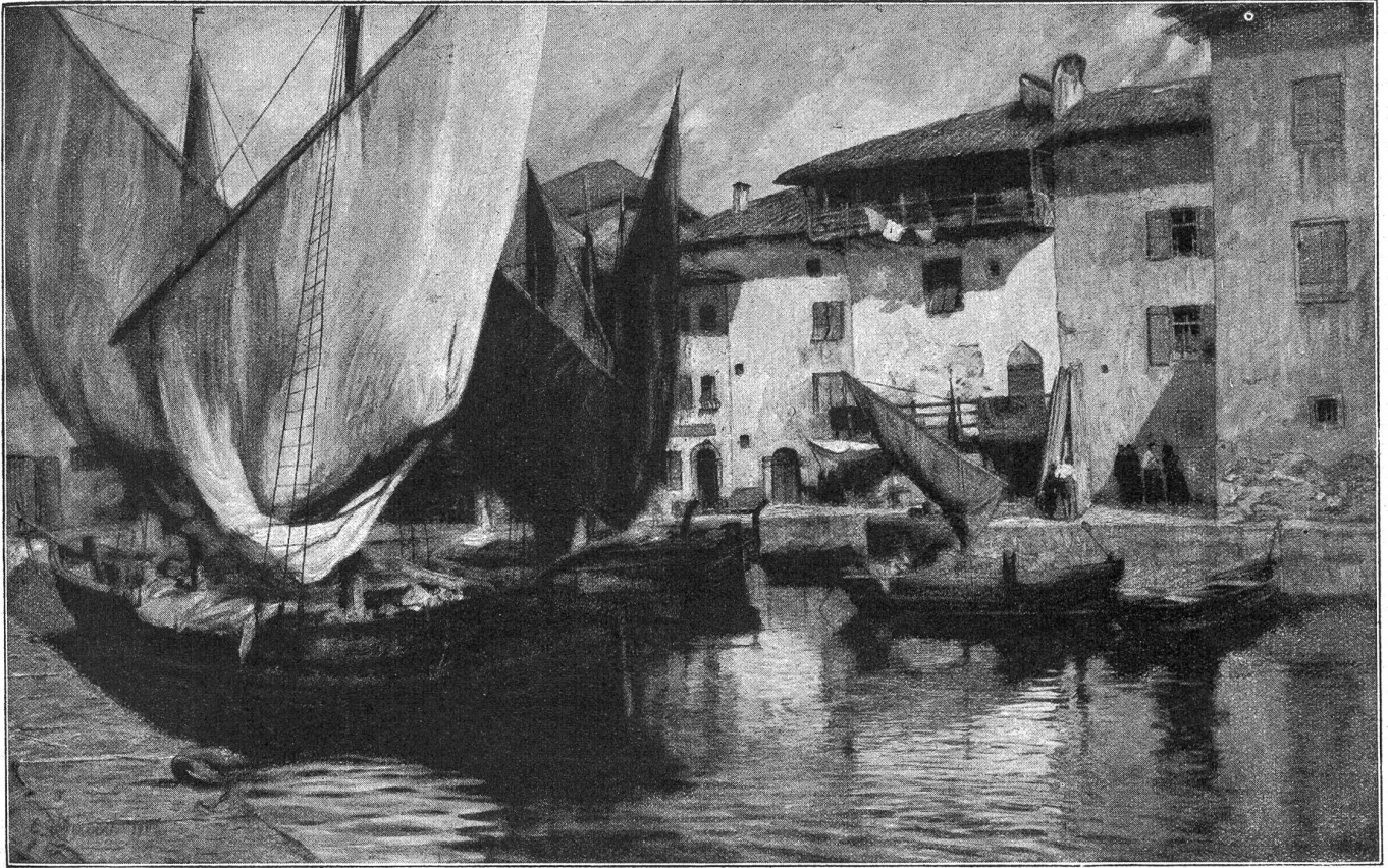
Im Hafen von Torbole (Gardasee). Nach einem Gemälde von Georg Macco.

Wunder zu schauen, auf das sie gewartet hatten. Sie gingen geradeswegs darauf zu, wohl etwas verlegen, aber mit festen, eiligen Schritten. Keinen Augenblick dachten sie an den Weg, den sie vielleicht verloren hatten; stand denn am Himmel nicht der Stern? Und war ringsum nicht überall etwas Geheimnisvolles, wie ein Säuseln von himmlischen Heerscharen, die auf leisen Fittichen herniederschwebten? Beva meinte jeden Augenblick das Weihnachtslied aus dem Himmel widerhallen zu hören. Sie zitterte am ganzen Leibe bei dem Gedanken daran, was sie jetzt alles erleben würde; sie bebte, spürte aber keine Kälte, denn sie war durchglüht von glücklicher Hingabe, sie dachte weder an ihre Mutter noch an zu Hause, sondern nur daran, was geschehen sollte, und sie ging mit den Mädchen, ohne sich nach Toni umzusehen. Da stand Lenchen mit einem Rud still und zeigte vorwärts. „Seht!“ sprach sie mit hellem Stimmchen und voller Freude, „seht unser Häuschen! Der Stern steht gerade über unserm Haus!“ Ihr Ruf war wie ein Gesang, der widerhallte und in der Weite verklang. Die Kinder guckten starr und sprachlos hin: wahrlich, der große helle Stern stand gerade über der Hütte, die wie ein einsamer Schneehügel dalag, klein und allein, weiß auf der weißen Fläche. Im Mondschein war sie dennoch gut zu erkennen, denn durch das Fensterchen blinzelte ein Lichtlein wie ein zweiter Stern, aber ganz dünn und klein. Ueberwältigt standen sie vor diesem neuen Wunder.