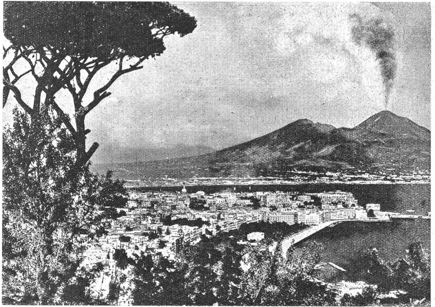
Neapel. Generalansicht mit Vesuv.

miliseausfuhr“, „Das landwirtschaftliche Italien“ und „Der Transportverkehr auf dem Lande“ bildeten einige der Vortragsthemen. Großer Beliebtheit erfreuten sich die Stadt-