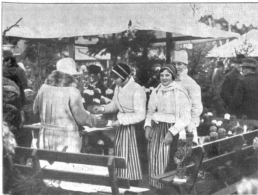
Weihnachtsmarkt in Stockholm

Das Julfest; so heißt Weihnachten, das Fest Christi Geburt, in Schweden! — ist in dem Lande der Mitternachts-sonne seit den undenklichsten Zeiten das größte Fest des Jahres. Seine Geschichte und Tradition reicht bis weit in die vorgeschichtliche und heidnische Zeit zurück, wo man noch die Wiederkehr der Sonne und das Längerwerden der Tage nach der Sonnenwende feierlichst beging. An diese Zeit erinnern besonders die Sternsänger, weißgekleidete, von Haus zu Haus ziehende, uralte deutsche Weihnachtslieder singende Knaben, mit einer Krone auf dem Kopf und Laternen in Sternform in der Hand, zu denen sich meist St. Nikolaus oder der Weihnachtsmann gesellt, der Gaben für die Armen in den Wohnungen und auf den Straßen sammelt. Ja, die Straßen. Man erkennt sie zur Weihnachtszeit gar nicht wieder. In jeder Groß- und Kleinstadt lebt sich in ihnen der traditionelle Weihnachtsmarkt