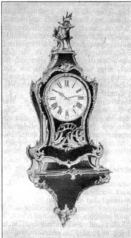
Pendule Louis XV. von Pierre Jaquet-Droz.

reizend ins Gesichtchen steht — eine ältere Frau im Bonnet Neuchâtelois — ein Mann mit Puderperücke — und mitten in all den alten Kleidern, Hüten, Uniformen, in den jungen