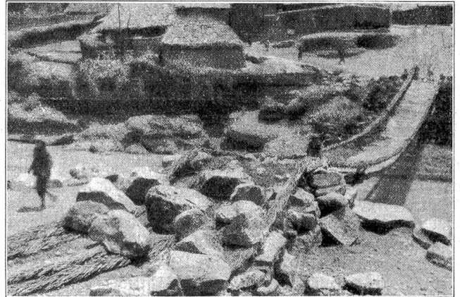
Eine andere Schwebebrücke. — Sie ist aus Pflanzen- und Wurzelfasern errichtet und unter Felsblöcken verankert.

feuchte Kälte drang uns bis auf die Haut. Ich hoffte, daß Wolken und Nebel bis Mittag verschwinden würden, das war aber nicht der Fall, sondern es wurde immer dunkler.