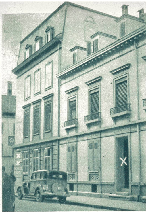
Die Privatpension an der Sperrstraße in Klein-Basel,

von wo aus die beiden Mörder die Flucht ergriffen hatten, zuerst zu Fuß und nachher per Velo, nach ihrem Revolverangriff auf die beiden Detektive der Schrittenkontrolle. — Links vom Bild das Restaurant zum »Goldenen Faß«, wo der tapfere Zähler den im Blute liegenden Polizeibeamten Nafzger, den einen der Detektive, vorfand und daraufhin sofort im öffentlichen Interesse die Verfolgung aufnahm. Hätte das Straßenpublikum seinen Zurufen einigermaßen Folge geleistet, so hätte man vielleicht die Mörder schon in Basel erwischen können.