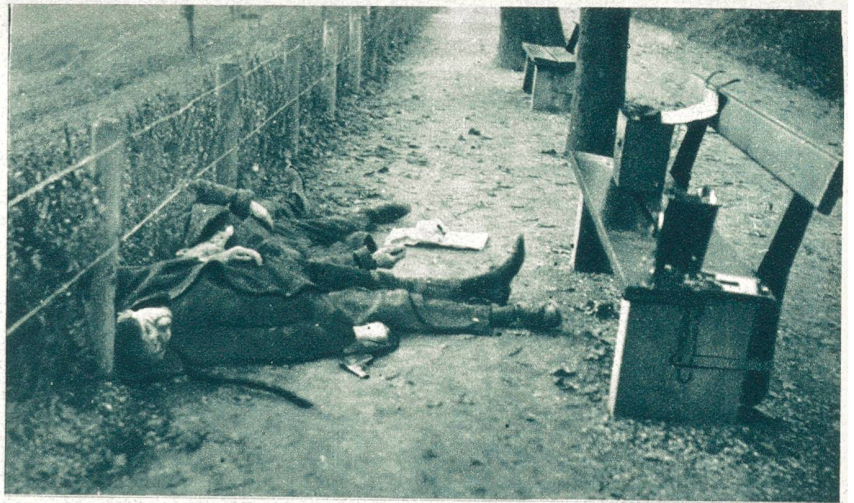
Die Leichen der beiden siebenfachen Mörder im Margarethenpark in Basel. Die Verbrecher hatten sich, nachdem der Park von der Polizei umstellt worden war, gegenseitig erschossen.