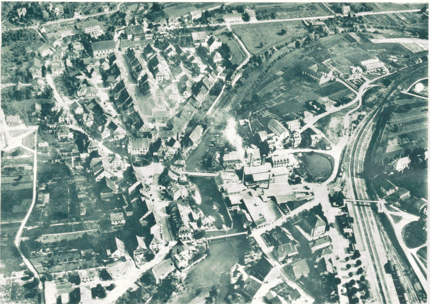
Das Städtchen Laufen im Berner Jura, aufgenommen aus 300 Meter.