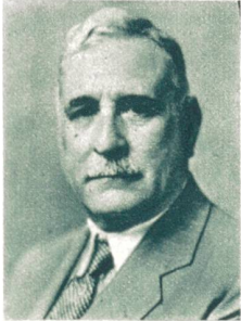
Carlos Mendieta , der frühere Führer der kubanischen Nationalisten, wurde zum Präsidenten von Kuba ernannt.