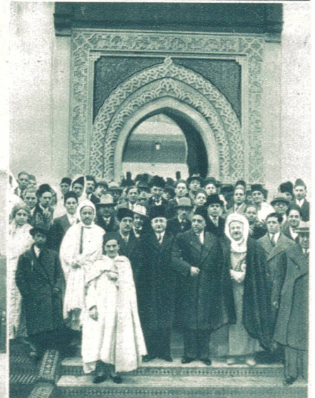
Mohammedanischer Festgottesdienst in der Moschee von Paris , an welchem zahlreiche mohammedanische Persönlichkeiten teilnahmen.