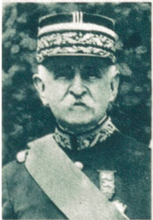
General Marchand , der »Held von Fashoda«, ist 71jährig gestorben. Während der englische General Kitchener seinerzeit im Sudan einen Aufstand niederwarf, drang General Marchand nach Fashoda, einem wichtigen Handelsort am Nil, vor, und hißte dort im Juli 1898 die Trikolore. Dies führte zu einem schweren Konflikt zwischen England und Frankreich, der dadurch beigelegt wurde, daß die Franzosen Fashoda wieder räumten.