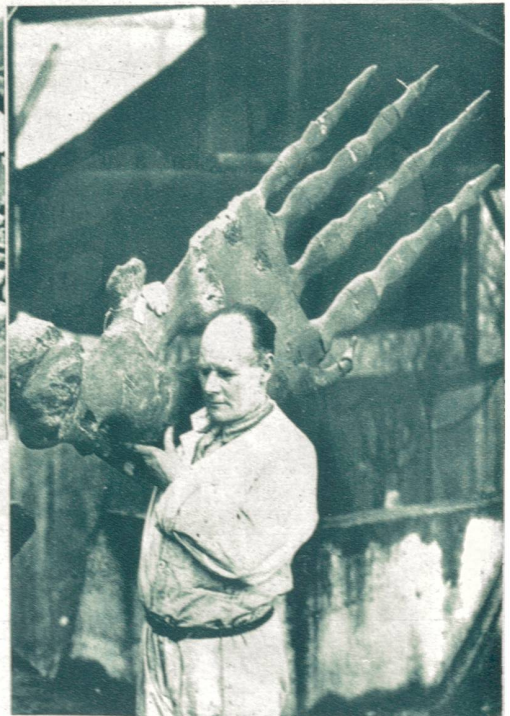
Wie mag das wirkliche vorhistorische Seeungetüm ausgesehen haben?

Das naturhistorische Museum Kensington in London ist im Besitze dieses gewaltigen Knochengestübes einer prähistorischen Walfischflosse, die einen Rückschluß auf die ungeheure Größe der Urwassertiere zuläßt.