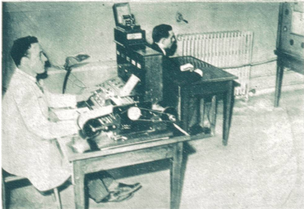
Links: Maßnahmen zur Hebung der Sicherheit der französischen Bahnen. Die französischen Eisenbahnbeamten müssen sich Eignungsprüfung unterziehen, die unter anderem auch darauf abstellt, wie rasch der Beamte auf Signalwechsel reagiert.

nach den wiederholten Eisenbahnunfällen einer besonderen Eignungsprüfung unterziehen, die unter anderem auch darauf abstellt, wie rasch der Beamte auf Signalwechsel reagiert.