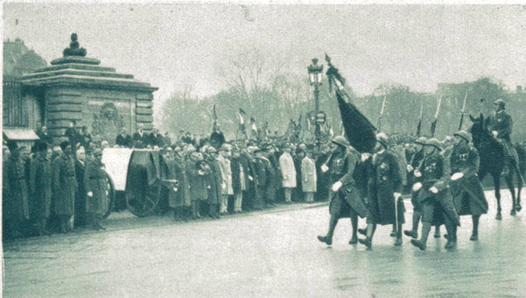
Von der Beisetzung des Generals Marchand. Defilee der Truppen vor dem Sarge. Vorbeimarsch der Fahngruppe der Kolonial-Regimenter.