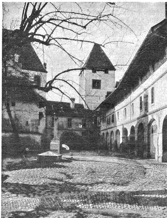
Der Burgweg mit dem breiten Hauptturm, der an seiner Front das Bernerwappen trägt.

Als stolzester Zeuge aus jener zähringisch-kyburgischen Zeit blieb das Schloß aber bis in unsere Zeit erhalten. Ein steiler Burgweg führt von der Hauptgasse aus zum Torturm empor, der neuern Datums ist und aus dem Jahre 1559 stammt. Hingegen stammen einige der halbrunden