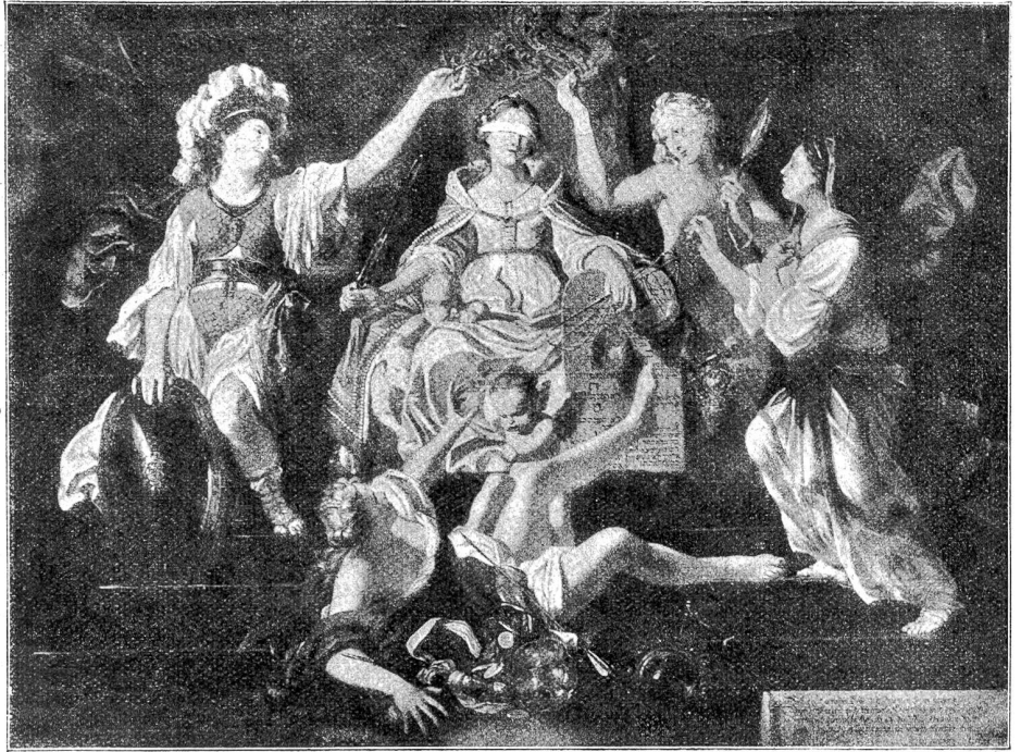
Die Gerechtigkeit. Allegorie im Stile der Barockzeit von Josef Werner, Hofmaler Ludwigs XIV. Das Bild schmückte den Berner Rathssaal; heute im Kunstmuseum Bern.

Immer und immer wieder werde ich von Wappenliebhabern und Leuten, denen ich Wappen gemalt habe, gefragt: „Was bedeuten eigentlich die Figuren in meinem Wappen?“ Darüber gibt nun die Wappensymbolik Aufschluß. Unter Symbolik versteht man diejenige Wissenschaft, die ein Symbol (Sinnbild) zu entschlüsseln weiß und die den hinter einem solchen verborgenen tieferen Sinn erkennen lehrt. Ihr Ursprung ist in der Bilderschrift der Ägypter zu suchen, die ihre Göttervorstellungen und ihre religiös-sittlichen Ideen vor allem Tier- und Menschengestalt annehmen ließen, die in Malerei und Plastik reiche Formen dafür fanden. Obschon die ältesten Christen in dem Lamm unter dem Kreuze bereits ein Sinnbild für Christus und seinen Opfertod erblickt haben, hat sich die sogenannte Tierymbolik erst im Mittelalter ausgebildet, und — wie naheliegend — zunächst besonders in kirchlicher Kunst. Die vier Evangelisten stellte man z. B. durch einen Engel (Matthäus), einen Löwen (Markus), einen Stier (Lukas) und einen Adler (Johannes), dar. Aber bald bemächtigte sich auch die weltliche Kunst dieser Attribute und nahm aus dem Tier- und Pflanzenreiche das ihr geeignet Erscheinende, indem sie alles zu beseelen verstand und sich in ihrer unerschöpflichen Phantasie darin nicht genug tun konnte. —