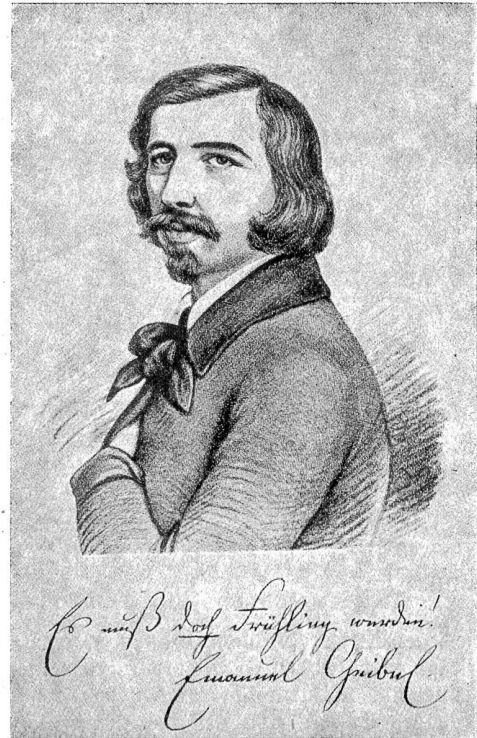
† Emanuel Geibel.

Stellen. In den Dramen dagegen vermochte er sich nicht durchzusetzen. „Die Lorelen“ wurde zwar von Max Bruch vertont. Mit „Sophoniste“ errang er sich 1869 den Schiller-