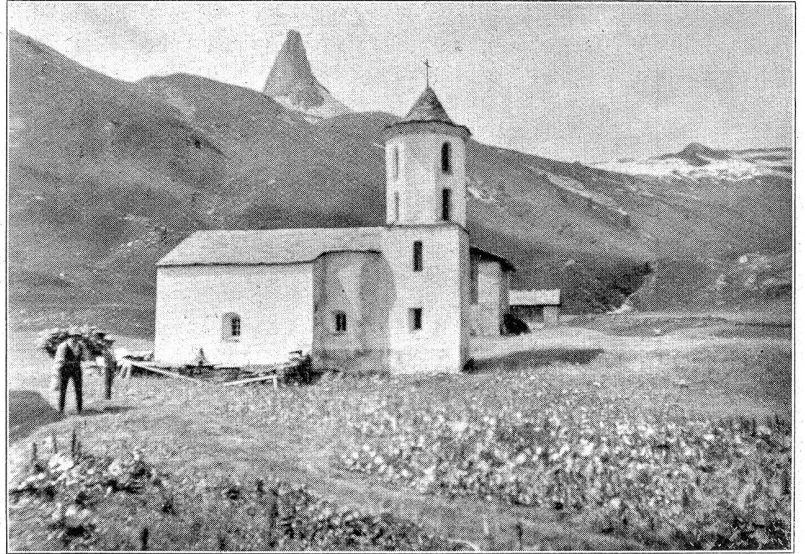
Zerfreila im Vals, 1780 Meter über Meer. Kirche mit Zerfreiler Horn.

Scheuten heutige Männer und Frauen die Arbeit in den höchsten Tälern nicht, würde der Staat diese Besiedlung tatkräftig fördern, wir glauben, aus alten Walsersiedlungen könnte noch einmal neues Leben erwachsen. Die Besiedlung der höchsten Alpentäler im Laufe der Jahr-