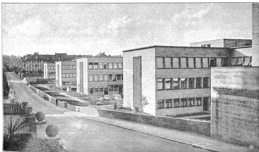
Neue Universitätsgebäude in Bern. Kantonschemie, pharmazeutisches Institut, mineralogisches und geologisches Institut.

Wie nicht anders zu erwarten war, feierte Bern, d. h. Kanton und Stadt, die Tatsache des erfüllten hundertjährigen Bestandes seiner Hochschule mit einem solennen Fest. Ein Fest der Geladenen, die Volksmenge als Zaungast — eine andere Form erschien nicht wünschbar angesichts des nahen „Bärnfestes“, das seinerseits das „Volk“, d. h. das ganze Volk, nicht nur das akademische, an seinen Busen ziehen und mit ihm herumwirbeln will.