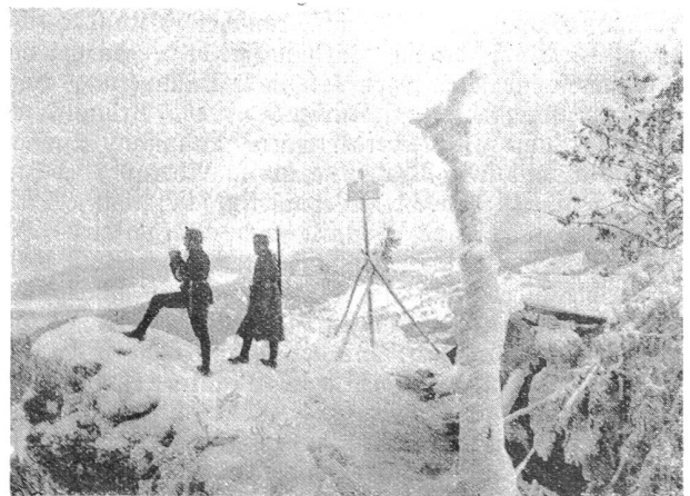
Les Rangiers im Winter.

Wenn wir noch nach Boécourt hinunter hätten gehen können! Der Ausgang blieb streng auf den „Ort“ beschränkt. Der erhöhte Bereitschaftsgrad und die zahlreichen Außenwachen sorgten dafür, daß kein Berwegener den übrigens sehr richtigen Befehl umgehen konnte. Wir befanden uns eben nicht im friedlichen Manöverkurs. So mußten wir an diesem und den nächsten Abenden unsern phänomenalen Durst am prächtigen Dorfbrunnen löschen. Um die gleiche Zeit wurden die belgischen Festungen eine nach der andern zu Fall gebracht. Wir wußten auch, daß im nahen Esaj gekämpft wurde und die Franzosen auf Müllhausen vorstießen. Drang nicht der Kanonendonner bis zu uns herüber? Dampf und in regelmäßigen Abständen? Einem findigen Kopf fiel etwas an der Sache auf — und richtig, es stellte sich heraus, daß die „Kanonenschläge“