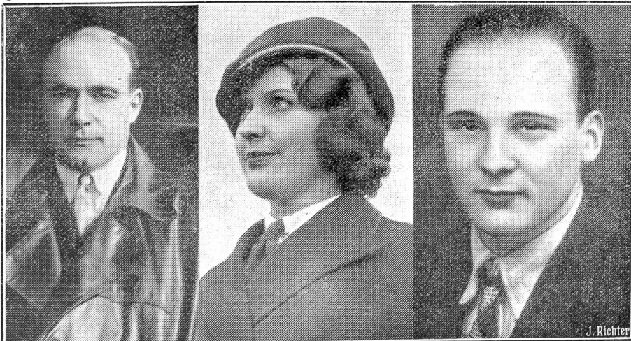
Zum Flugzeugabsturz „Condor“.

Aus dem Kassenschrank der „Radibus A.-G.“ in Basel wurde Ende Juni ein Postschek von über Fr. 5000 gestohlen und das Geld am 2. Juli von einer unbekannteren Frau am Postschalter abgehoben. Die polizeilichen Recherchen blieben bis jetzt erfolglos, trotzdem auf die Ermittlung der Täterschaft eine Belohnung von Fr. 500 ausgesetzt wurde. — Auf Veranlassung der Basler Polizei gelang es in Brüssel, Prag und Riga, vier internationale Gauner zu verhaften, die u. a. im Oktober 1932 einem Bieler