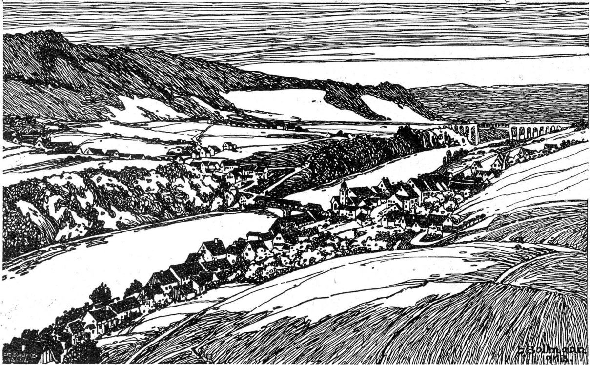
Eglisau. Zeichnung von E. Bollmann.

ihr umzublicken. Als ob er schon oft im Unfrieden von ihr geschieden wäre.