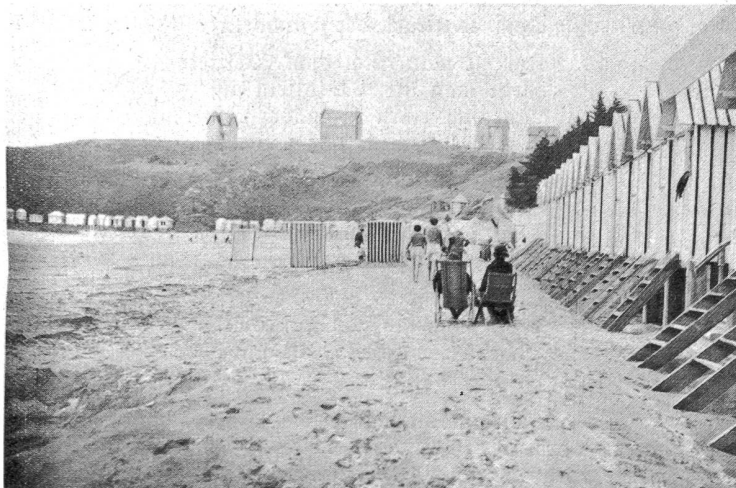
Plage von Caroual bei Erquy.

Die Beschaffung und Verteilung von reichem, gesundem Lesestoff unter Fernhaltung jeder Schund-