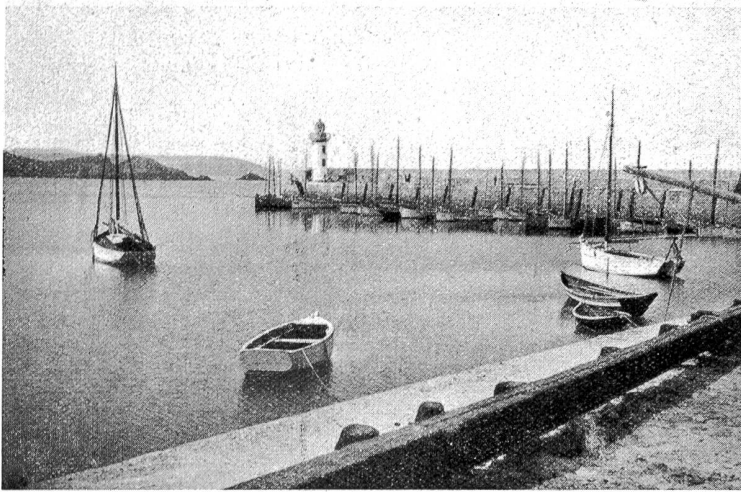
Hafen von Erquy.