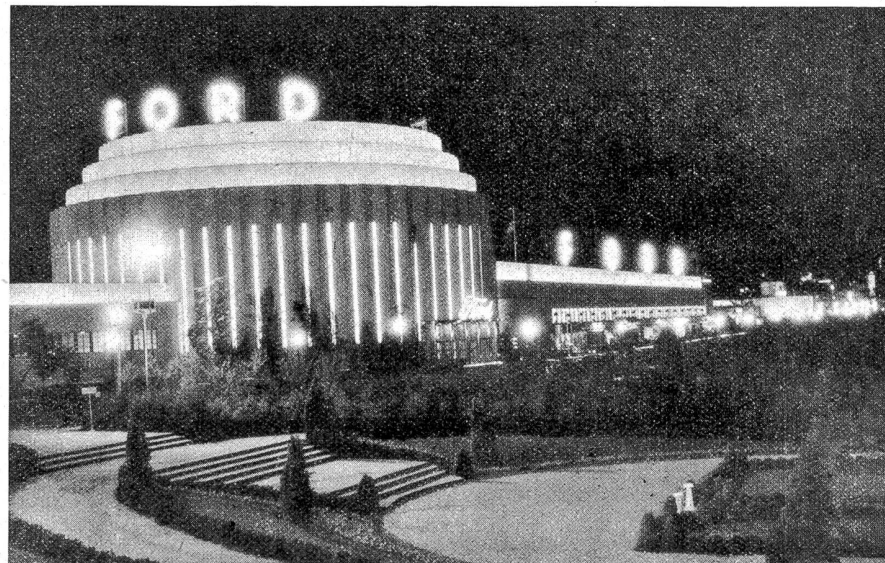
Ford-Ausstellungspalast bei Nacht an der Weltausstellung in Chicago.