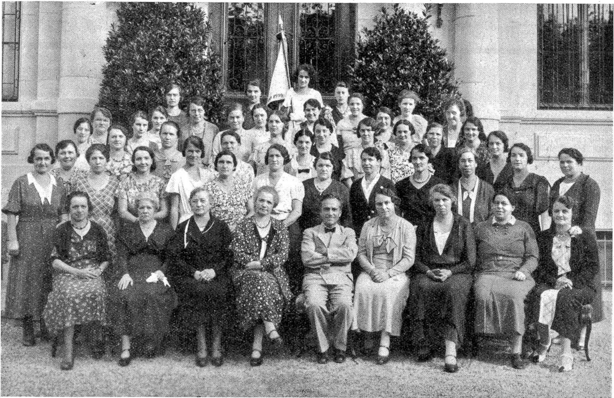
Der Berner Frauenchor Länggasse.