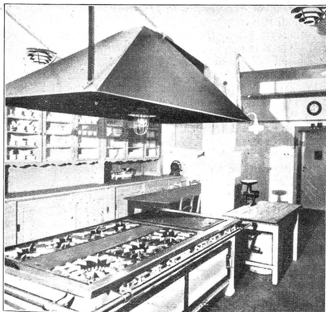
Künstliches Klima in der Küche! Die warme Luft wird durch den über dem Herd liegenden Schornstein abgesaugt; die Zuführung der künstlich vorbehandelten Luft erfolgt durch die an der Decke sichtbaren Apparate.

Die beiden Brüder Grimm gehören zu den bedeutendsten und wertvollsten Gelehrten des 19. Jahrhunderts. Sie schenken uns nicht nur die wundervollen deutschen Märchen, heute noch das Entzücken von jung und alt, sie sind die Begründer der modernen Sprachwissenschaft und der deutschen Volkskunde. Am 4. Januar 1935 waren 150 Jahre verflossen, seit der ältere, Jakob Grimm, in Hanau als Sohn des Stadt- und Landtschreibers, zur Welt kam. Wilhelm ist ein Jahr jünger, geboren am 24. Februar 1786. Zeit lebens arbeiteten die beiden gemeinsam, müssen daher auch gemeinsam gewürdigt werden. Sie schliefen als Kinder im gleichen Bett und arbeiteten am gleichen Tisch. In der Studentenzeit standen zwei Betten und zwei Tische im selben Zimmer, im späteren Leben immer noch zwei Arbeitstische im nämlichen Stübchen. Zuletzt hatten sie zwei Arbeitszimmer nebeneinander, immer unter demselben Dache in gänzlich unangefochtener Gemeinschaft ihrer Habe und ihrer Bücher, mit Ausnahme weniger, die immer zur Hand sein mußten und daher doppelt gekauft wurden. Wilhelm war verheiratet, Jakob in dessen Familie als zweiter Vater, zeit lebens unverheiratet, verehrt und geschätzt. Beide besuchten das Kasseler Lyceum, erhielten bei der Entlassung im Jahre 1802 das Zeugnis herrlicher Geistesgaben und unaufhalt-samen Fleißes, beide studierten in Marburg unter Savigny die Rechtswissenschaft.