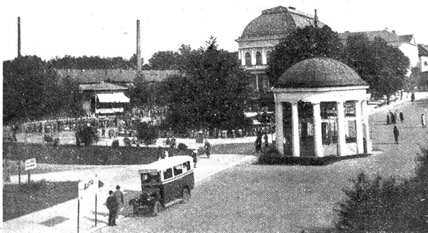
Franzensbad mit Franzensquelle.

Merkwürdig: Ein Leberkranker ist einfach leberkrank, ein Zuckerkranker zuckerkrank. Aber daneben ist er normal.