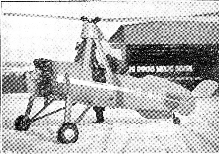
Die Schweiz besitzt ihr erstes Autogyro-Flugzeug.

Auf dem Flugplatz Belpmoos-Bern ist das erste senkrecht aufsteigende und landende Flugzeug eingetroffen, das von der Berner Luftverkehrsgesellschaft gekauft wurde. Dieser Flugzeugtyp stellt den schweizerischen Luftverkehr vor neue Möglichkeiten, speziell im Kleindienst und Zubringerdienst, indem mit diesem Flugzeug überall dort gelandet werden kann, wo kein eigentlicher Flugplatz vorhanden ist. Die Versuchsflüge in Bern unter Leitung von Ingenieur Gsell vom Eidg. Luftamt haben begonnen. Das Berner Autogyroflugzeug wurde in London gebaut und durch einen englischen Fabrikpiloten, der den Versuchsflügen ebenfalls beiwohnte, nach der Schweiz gebracht. Unser Bild zeigt das Autogyro-Flugzeug der Alpar auf dem Berner Flugplatz anlässlich des ersten Probefluges.