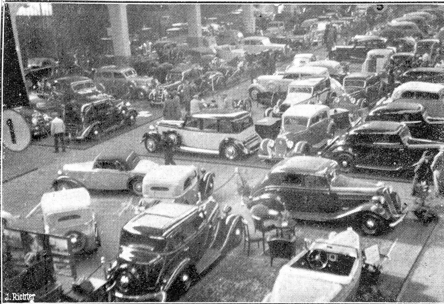
Der XII. internationale Automobil-Salon in Genf. Blick ins Innere des Salons.