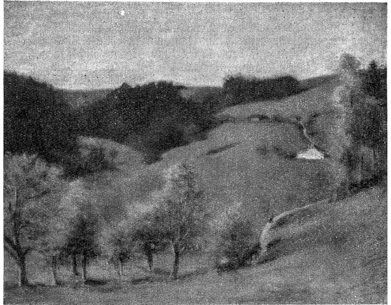
Werner Neuhaus: Herbststimmung, Grabenhalde 1930.

Dem nicht nur körperlich krank war die stolze Yolanda, welche vom Morgen bis zum Abend in wallenden, weißen Gewändern auf der nach dem See liegenden Terrasse zu