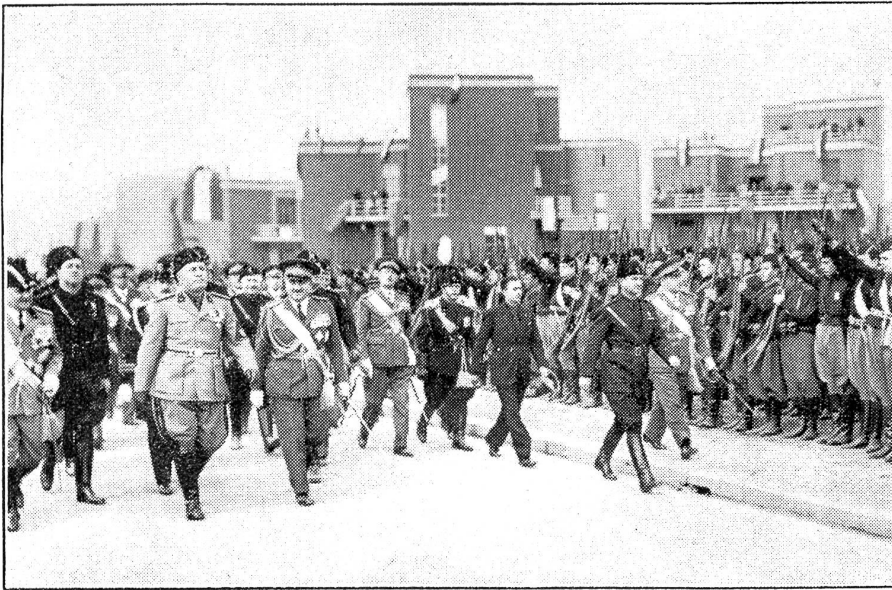
Mussolini gründet Guidonia, die 4. Stadt von Pontinien.

In den Pontinischen Sümpfen ist nun die 4. Stadt entstanden. Mussolini nahm an der Gründungszeremonie teil. Guidonia, die frisch erbaute Stadt, liegt in der Nähe des Flughafens Montecelio, 20 km von Rom, und ist mit seinen kleinen, modernen Häusern fast nur für Flieger-Familien reserviert. Der Name dieser Stadt stammt von General Guidoni, der am 27. April 1928 bei Fallschirm-Experimenten den Tod fand. Der Regierungschef hielt zur Einweihung von Guidonia eine Rede, in der er bemerkte, daß Italien mit dieser Gründung ein neues Zeugnis ablegt von seinem Arbeitswillen. Unser Bild zeigt Mussolini die Strassen von Guidonia durchschreitend.