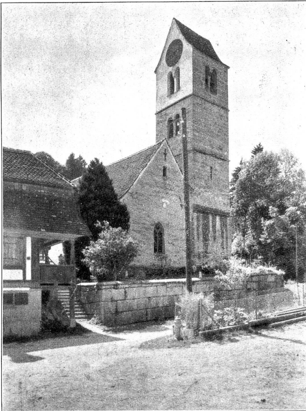
Die Kirche in Aetingen, am Südfusse des Bucheggbergs.

den Solothurnern erbaut. Die Grafen von Buchegg waren Bürger von Bern und Solothurn und bekleideten auch im Ausland hohe Ehrenstellen. Peter von Buchegg war 1253 Schultheiß zu Bern, Hugo von Buchegg 1315 Schultheiß von Solothurn. Auch die bereits genannte Burg Balmegg gehörte den Herren zu Buchegg. 1391 ging die Herrschaft Buchegg um 500 rheinische Gulden an Solothurn über. Der Bezirk führt heute das Wappen seiner ehemaligen Herren. Wir sehen in Gold 3 pfahlständig gelegte Rosen mit grünen Kelchzipfeln und silbernen Butzen (Samen).