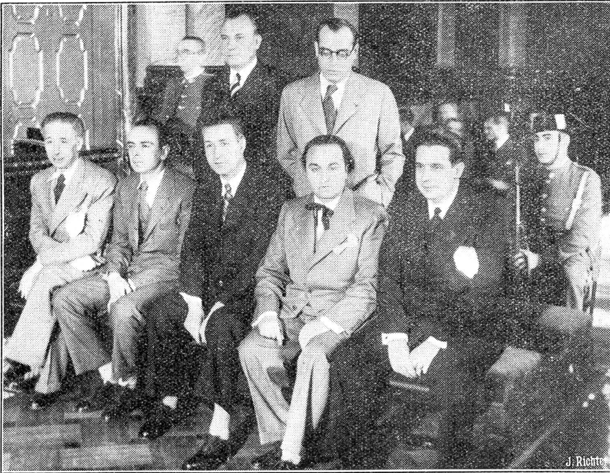
Die Führer der separatistischen Rebellion Cataloniens auf der Anklagebank.

In Madrid begann dieser Tage vor dem Obersten Gerichtshof der Prozess gegen die catalonischen Separatistenführer, die im Oktober 1934 die Unabhängigkeit Cataloniens erklärt hatten. Bekanntlich wurde dieser Aufstand von den spanischen Truppen niedergeschlagen. Unser Bild zeigt den Haupttrüffelsführer, den Expräsidenten von Catalonien M. Companys (links), neben ihm seine Mitverschworenen.