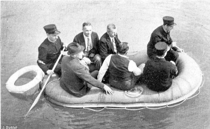
Ein moderner Wasserrettungsdienst der Basler Feuerwache.

Als erste schweizerische Berufsfeuerwehr hat die Basler ständige Feuerwache zur Hilfeleistung auf dem Wasser (bei Unglücksfällen im Schiffsverkehr oder an den Badeorten) ein Gummiboot und eine Taucherausrüstung angeschafft. Das Gummiboot wird auf der Fahrt zur Unglücksstelle aufgepumpt und vermag zehn Personen zu tragen. Die Taucherausrüstung besteht aus einem braunen Gummüberzug (ohne den schweren Kupferhelm) Bleisandalen „Taucherherzen und Taucherketten“ (Bleiklumpen im Gewicht von 35 kg) und Kreislauf-Sauerstoffgerät, mit dem er über eine halbe Stunde unter Wasser verbleiben kann. 30 Mann der ständigen Feuerwache haben sich diesem Dienst unterziehen müssen. Unser Bild zeigt das bemannte Gummiboot, von Feuerwehrleuten gesteuert.