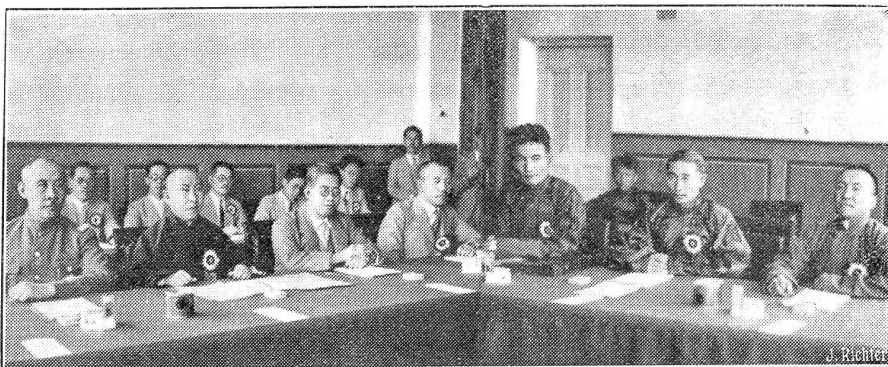
Die Mandschuli-Konferenz tagt.

Lord Siegelbewahrer Eden hat Laval in Paris besucht und ... habe ihn völlig über das deutsch-britische Flottenabkommen beruhigt. So meldet ein Communiqué. Was hat Eden Laval gesagt? Wirklich nur das Eine, daß England nach wie vor an den Abmachungen vom Februar festhalte und weiterhin in der gleichen Front mit Frankreich stehen wolle? Die grundsätzliche Bedeutung des Flottenabkommens besteht darin, daß die Deutschen ihre Flotte nie über 35 Prozent der gesamtbritischen steigern dürfen. Dem deutschen Wettrüsten ist damit ein Kiegel geschoben. Das von England hiemit zum erstenmal gegebene Beispiel soll aber Schule machen. So ist es der Wille Englands. Die Deutschen sollen noch eine Reihe von Konzessionen erhalten, mit jeder Konzession aber einen weitem feierlichen Verzicht leisten.