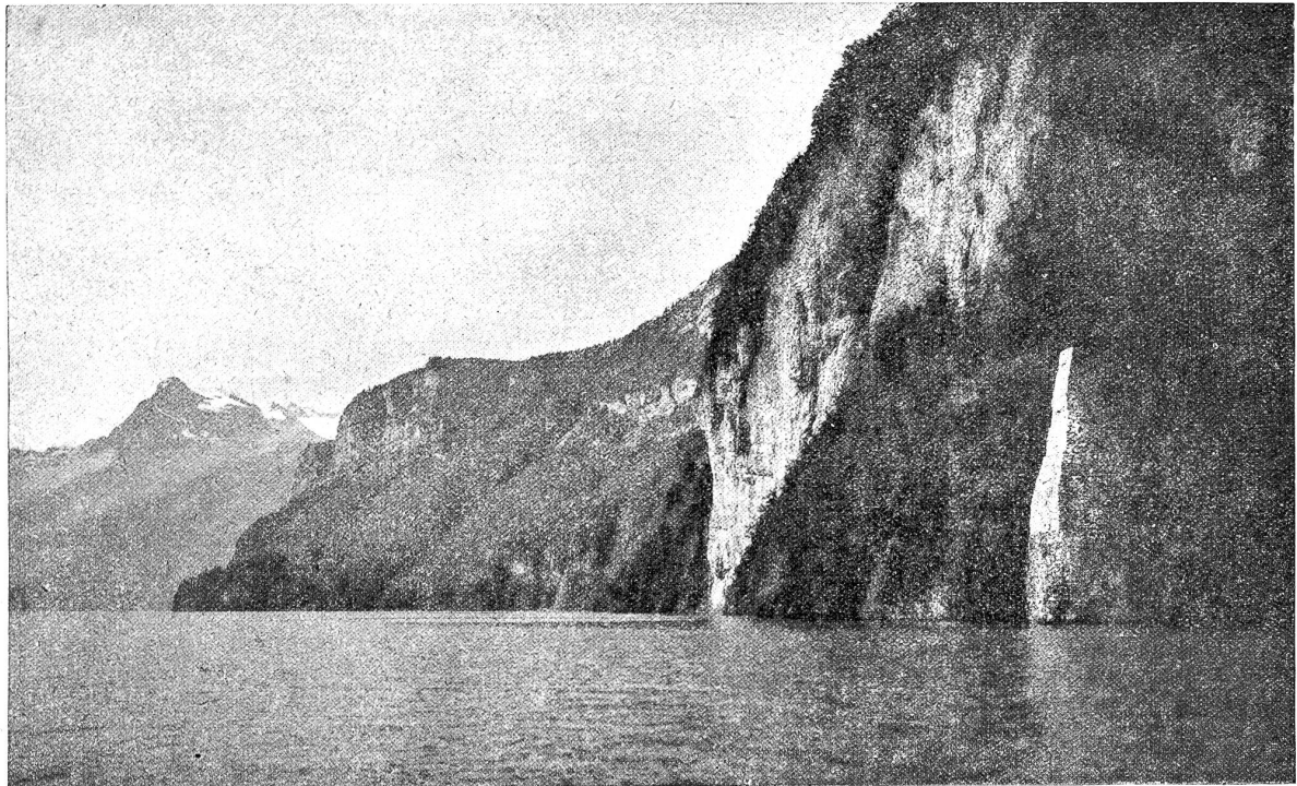
Rütliwiese und Schillerstein.

Thornbaumes auf Heiletsboden. Er hat viel gesehen auf seiner Warte. Gräßliches hat er erlebt. Doch immer ist es wieder einmal Sommer geworden, und er hat geruhsam über die blauen Hügel hinausblicken dürfen, die sich fernhin überschneiden, gleichsam als Falten im alten Erdgesicht.