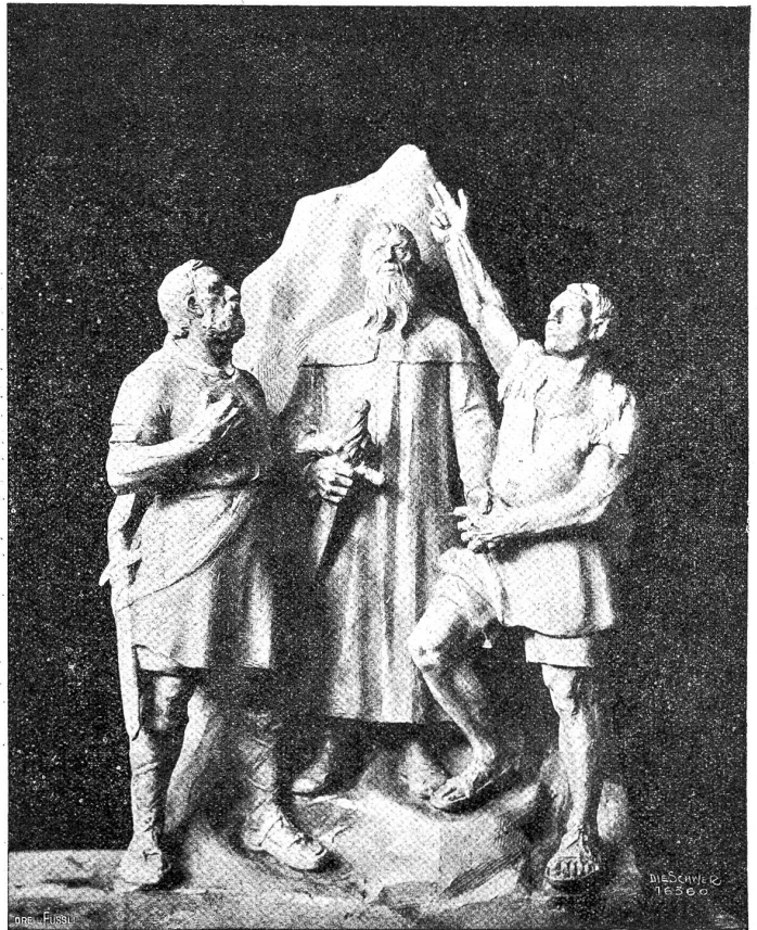
Rütli-Gruppe. Nach dem Entwurf (1905) von August Heer, Basel-München.

ellschaft verwaltet werden dürfe unter Oberaufsicht des Bundesrates.