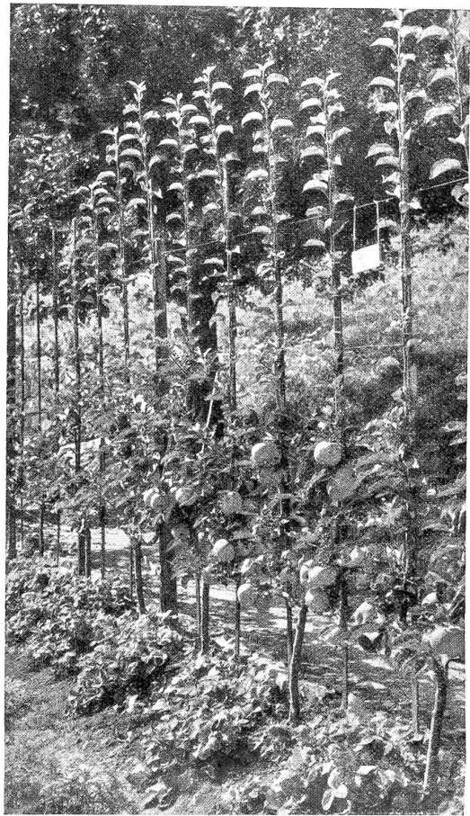
Vierjährige U-Formen des Ontario-Apfels reich mit Früchten beladen, an einem freien Spalier im Nutzgarten der Gartenbauschule Brienz.

Es ist ein selbstgeschaffenes Reich oberher dem Dorfe mit schöner Berg- und Seeanblick. Einheimische und auswärtige Besucher staunen, was kühner Unternehmungsgeist