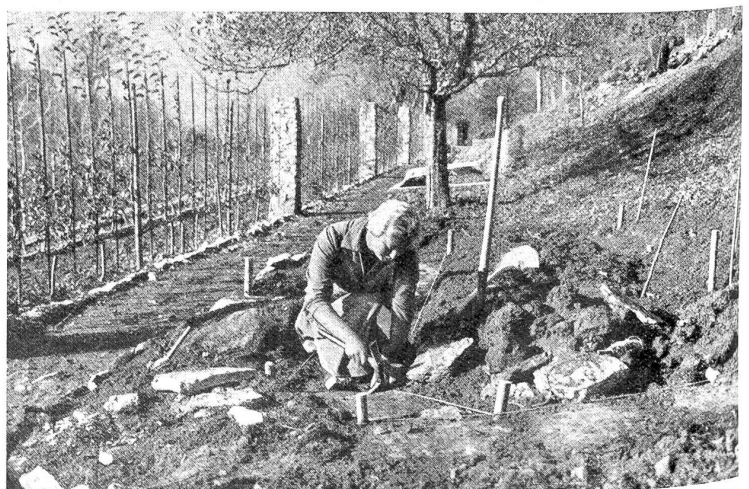
Werkmäßige Uebung beim Legen von Plattenwegen. Der neue Gewürzgarten wird angelegt.

Es ging aber auch etwas Mütterliches, Starkes von dieser Frau aus, die gleichsam die Seele auf der Alp und die vorbildlichste unter allen Arbeitskräften war. Nie sah man sie untätig und auch nie mißmutig, obschon ihr das