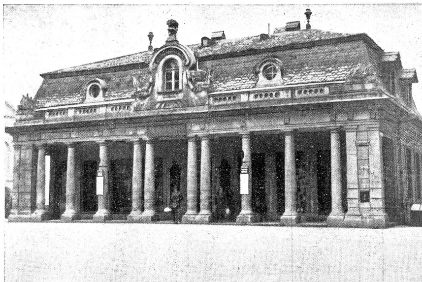
Die „Alte Hauptwache“ in Bern und die Kasinoplatzfrage. Dieses einzig schöne Bauwerk aus der glorreichsten Epoche der bernischen Baugeschichte soll unserer Stadt erhalten bleiben. Eine gute Lösung steht in Sicht. Die kantonale Baudirektion hat vier massgebende Architekturfirmer der Stadt mit der Ausarbeitung von Vorschlägen beauftragt. Ihre Aufgabe ist, die bestmögliche Verkehrsführung herauszufinden bei Balassung der Hauptwache an heutiger Stelle.

Uebrigens taucht dieser „Toilettenstreit“ schon seit ich denken kann immer zugleich mit der Hundstagsfeeschlange auf, die z'Bären demalen allerdings durch die „Kasinoplatzfrage“ ersetzt wurde. Die will nämlich auch nicht zur Ruhe kommen und da die Aestheten das Hauptgewicht auf einen baulich schönen, die Verkehrsanbieter aber auf einen geräumigen Kasinoplatz legen, so wird die Frage wohl überhaupt nicht so bald entschieden werden. Der Kasinoplatz aber wird auf irgendeine Art und Weise umgebaut werden, mit der dann überhaupt niemand mehr zufrieden ist. Wir z'Bären sind ja doch meist nur für Mittellösungen zu haben, das heißt, beide Parteien parlamentieren so lange um den heißen Brei herum, bis keine mehr weiß, was sie ursprünglich eigentlich wollte und dann einigen sie sich auf eine Lösung, an