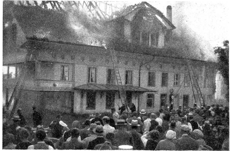
Der Brand vom Gasthof zum Bären in Biglen.

Der kantonale Trachtenzug in Lützelbach am 1. September war außerordentlich gut besucht. Es wurden folgende 10 neue Gruppen in die kantonale Vereinigung aufgenommen: Lengnau, Nidau, Herzogenbuchsee, Neueneegg, Mühlethurnen und Umgebung, Burgdorf, Frutigen, Adelhoden, Twann und Worb. Damit ist die Zahl der Mitglieder auf 1121 gestiegen. Nachmittags fand dann der prächtige Feltzug, angeführt von Dragonern in alter Uniform, statt. Der Festplatz füllte sich mit