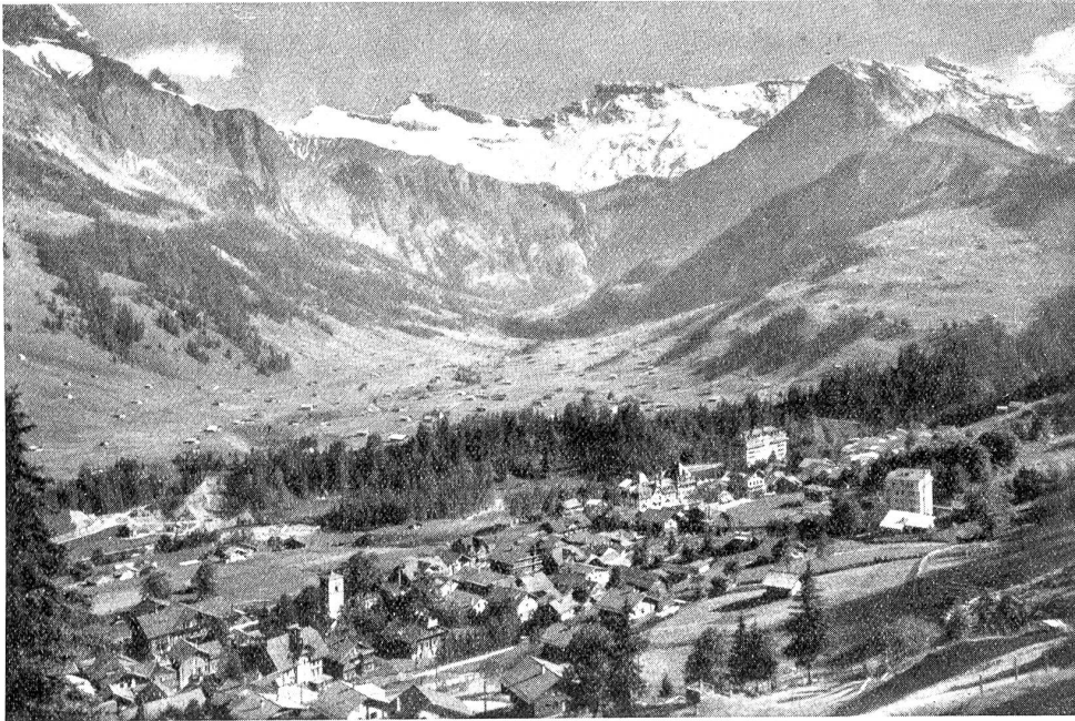
Adelboden mit Steghorn und Wildstrubel.

bot uns eine zu kurze Arbeitszeit, wir setzten ihr des Morgens und des Abends zu, dennoch war sie unser liebster Gefährte, wir grüßten sie, wenn sie morgens zu uns stieß und wünschten ihr geruhlsame Nacht, wenn sie uns abends verließ und tief am Himmel uns winkte, ihrem Beispiele zu folgen.