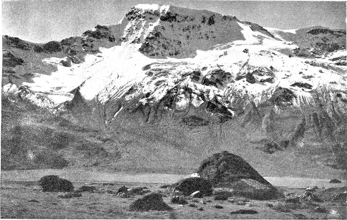
Engstligenalp mit Wildstrubel.

Aus dem einstigen stillen, abgelegenen Bergdörfchen Adelsboden ist mit den Jahren sozusagen eine internationale Berühmtheit geworden. Um das einfache „Schlegeli“ erheben sich heute stolze Hotelbauten und Pensionen. Daß Adelsboden auch als Winterkurort und Winter Sportplatz einen hohen Rang einnimmt, sei hier nur nebenbei erwähnt. Sein Gelände eignet sich für Ski- und Schlittelsport in ganz besonderer Weise.