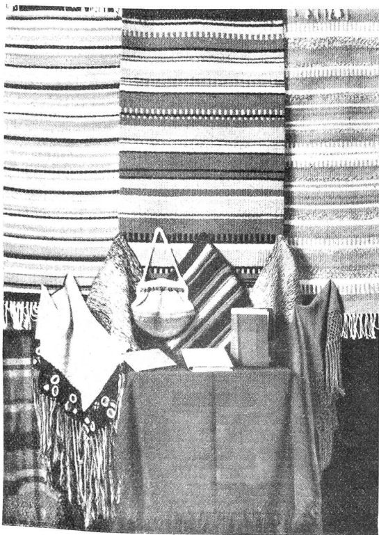
Handwebereien aus dem Simmen- und Frutigtal.

Sein Erbauer war Abbé A. Ebenrecht, der 1872 geboren wurde, am 16. Juni 1927 in Straßburg starb und in Hofsheim begraben wurde. Schulkinder halfen dem Priester beim Bau des Denkmals. Ohne irgendwelche Entschädigung wirkten nach Feierabend beim Bau dieses eigenartigen Soldatendenkmals die Arbeiter des Dorfes mit. Bauern befragten kostenlos alle Führungen. Im Jahre 1921 wurde der Bau vollendet; er dauerte viereinhalb Monate. Im ganzen Dorfe wurden Geschirrscherben gesammelt und überall am Denkmal mosaikartig eingelegt. Selbst die vielen Sockeln der Umzäunung leuchten in dieser reizvollen Buntfarbigkeit. Man verwendete außerdem einen rötlich gefärbten Lehm. Sogar die vielen Sprüche religiösen Inhalts und die übrigen Aufzeichnungen sind eingelegt. Eine Sisyphosarbeit sondergleichen! Die Inschriften berichten auch über die Zahl der Gefallenen und über die Zahl der im Exil Verstorbenen. Die jüngste Person, die im Exil starb, war 7 Jahre alt und die älteste zählte 89 Jahre. Das Denkmal ruht auf einem Fundament, das eine Dide von einem Meter hat. Zuerst auf dem Denkmal befindet sich ein Kreuz mit einer Christusfigur. Fünf Meter hoch ist dieses Kreuz und hat das respectable Gewicht von vier Zentnern. Auf