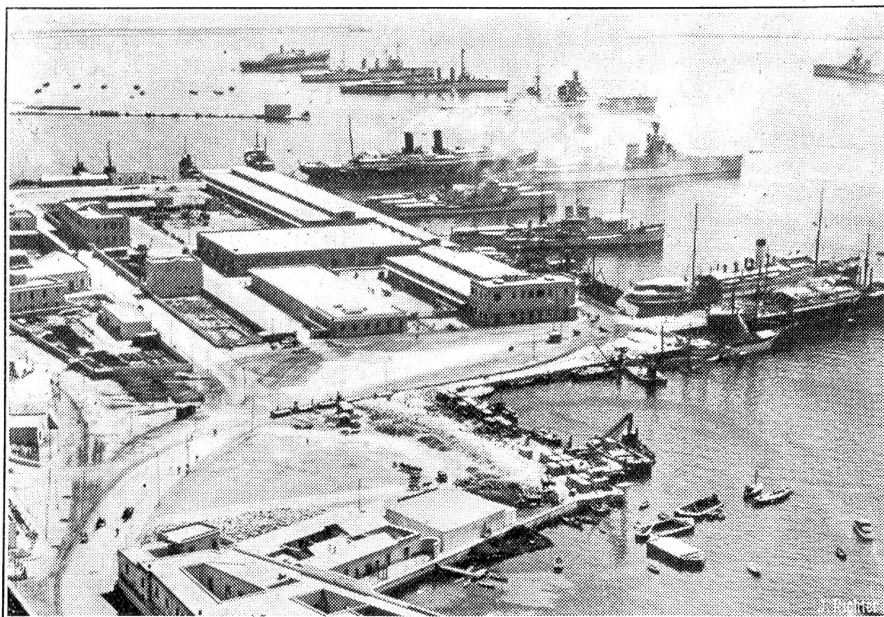
Italienisches Geschwader im neuen Hafen von Tripolis, wo ebenfalls Sicherungen für den Ernstfall vorgenommen werden.

Memeler Wahlausgang anschließen möchte. Ließt man jedoch die britische Erklärung aufmerksam durch, so entdeckt man Klauseln. Großbritannien wird „alle Beschlüsse der Mitglieder des Völkerbundes überall und jederzeit durchführen“. Das heißt, es setzt voraus, daß solche verpflichtenden Beschlüsse vorhanden sein müssen, und bekanntlich kann man ihr Zustandekommen sabotieren, wenn sie unbequem würden. Praktisch wichtiger als diese Proklamation ist die englische Anfrage an Frankreich, was es zur Unterstützung Englands zu tun gedenke für den Fall eines Konflikts im Mittelmeer. Die Frage lautet also fast genau wie die französische: Was gedenkt England zu tun, wenn irgendwo in Europa Versuche unternommen würden zur gewaltsamen Aenderung der bestehenden Verhältnisse?