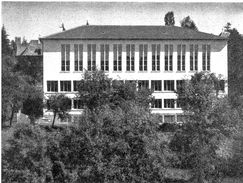
Kirchgemeindehaus Johannes. Westfassade.

Der Voranschlag von Fr. 600,000 mußte nicht überschritten werden. Für die Arbeiten konnten 120 im allgemeinen bernische Firmen berücksichtigt werden. Mit dem Erd-aushub wurde am 24. Juli 1934 begonnen; am 22. Oktober war der Neubau aufgerichtet, und am 7. September 1935 war das Gebäude zur Möblierung und Einrichtung bereit. Am 28. September wurde es mit einer kleinen Feier der Kirchengemeinde übergeben. H. C.