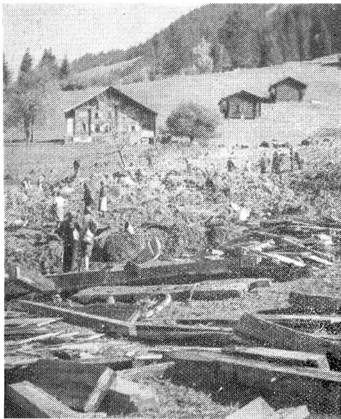
Ein Bauernhaus vom Unwetter zertrümmert.

Wie wir in der letzten Nummer berichteten, riss ein durch das Unwetter verursachter Erdrutsch unweit Saanen (bei Rougemont) ein Bauernhaus mit, wobei drei Menschen ums Leben kamen. Unser Bild zeigt die Trümmerstätte.