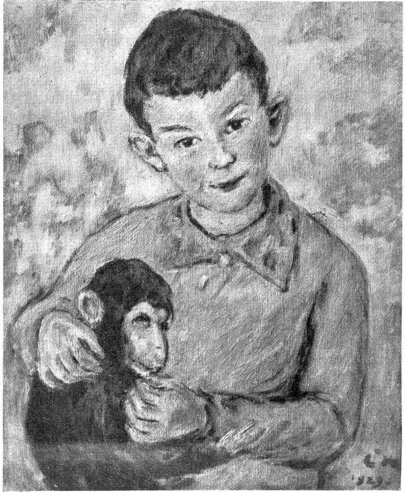
Louis de Meuron, Marin: Denys. Aus: O mein Heimatland 1936. Verlag Dr. Gustav Grunau, Bern.

Das Schiff hatte sich unterdessen mit festtäglich gekleidetem Volke gefüllt. Die Orgel begann zu jubeln, Geigen verhauchten sehnsüchtig, der junge Priester im golddurchwirkten Ornat, die Leviten und Chordienner, seine geistlichen Verwandten, die Braut und Meinrad, sein großer Gönner, hielten Einzug in die Kirche, königliche Ehren wur-