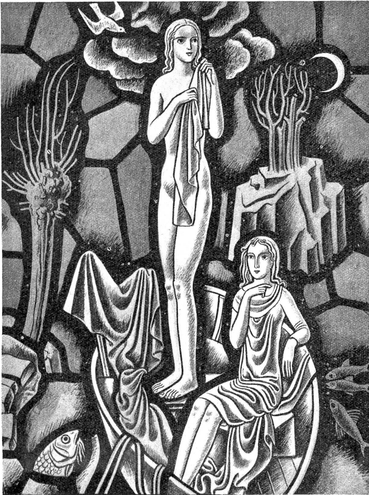
Albin Schveri: Badende Mädchen. Kabinetscheibe. Die weissen Figuren sind in tiefblau und rot gebrannt, in die das Grün der Fische und der Sträucher und Bäume eine eigenartige Note wirft.

Wenn wir Albin Schveri als einen Künstler der Glasmalerei von echt schweizerischem Gepräge feiern, der das schweizerische Glasbild auf neue Wege setzt und ihm die Richtungen weist, die bloß in Anerkennung alter, unumstößlicher Gesetze zum Ziele führen, so erscheint uns die Stellung dieses Künstlers in unserm Kunstschaffen und -leben als gefennzeichnet. Ein Wunsch sei an diese Ausführungen geknüpft: daß das profane Glasbild, die Glückwunschscheibe, das Glasbild, das ein Familienereignis feiert, das Wappenbild in Glasmalerei wieder Sitte bei uns werde.