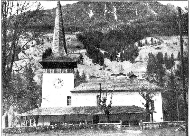
Kirche in Därstetten.