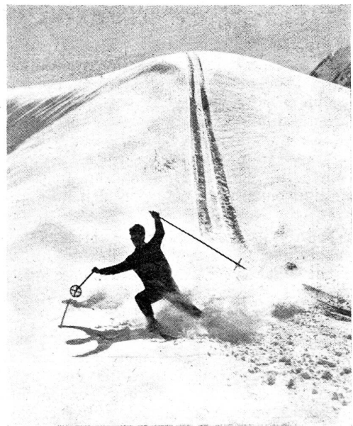
Bei Adelboden, rassige Abfahrt.

PS. Schickt mir ein Paar neue Skihosen, möglichst mit Lederbeleg. Meine sind schon zweimal gestickt und das sieht gar nicht chic aus.