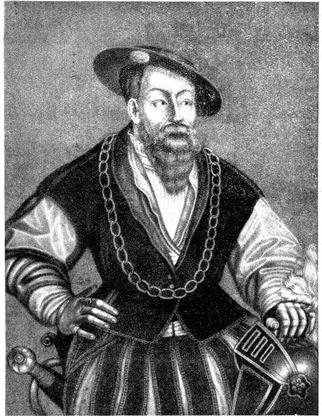
Hans Franz Nägeli, der Eroberer der Waadt, Schultheiß der Stadt und Republik Bern.

Zu Moudon setzten sie einen Landvogt ein. In Genf zogen sie als Befreier und Sieger am 2. Februar 1536 ein. Die Ländchen Gex und Chablais wurden ebenfalls erobert.