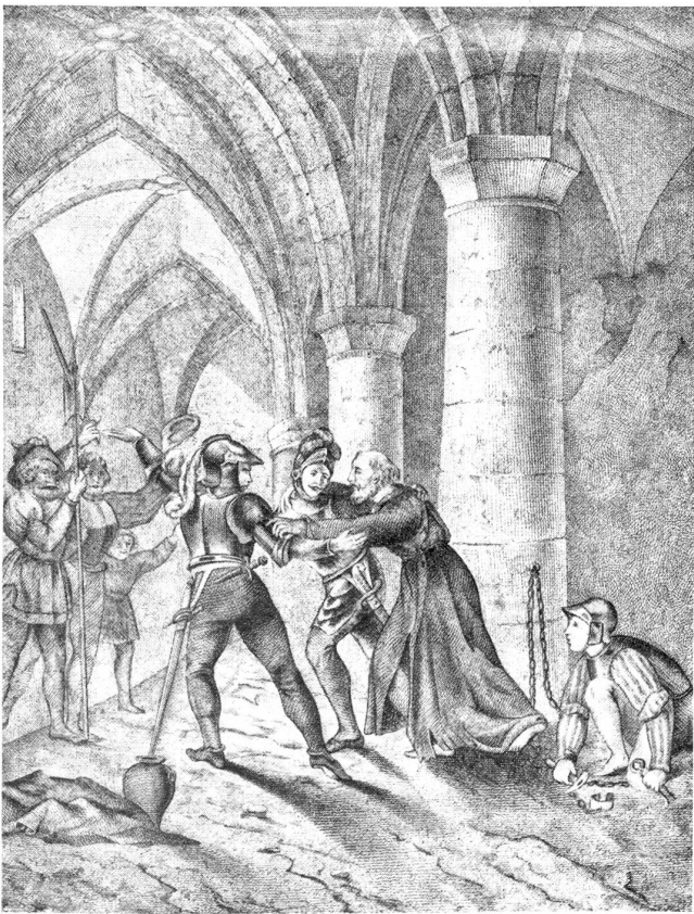
Bei der Eroberung des Schloßes Chillon durch die Berner am 29. März 1536 wurde der 6 Jahre unschuldig gefangene Genfer Geschichtsschreiber Bonnivard befreit.

Glorreich war der Kriegszug. Sozusagen ohne Schwertstreich besetzten die Berner in raschem Zug die ganze Waadt.